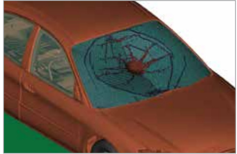
XFEM 기법을 통한 유리 파손 시뮬레이션

을 제공합니다. 또한, 같은 알테어 제품 중, 라디오스의 자동차 충돌안전 시뮬레이션을 위한 우수한 모델링 환경을 제공하는 하이퍼크래시(HyperCrash)라는 제품도 있어, 효과적인 모델링 작업 또한 가능합니다.